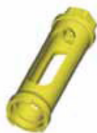
EC - Zeta удлинитель