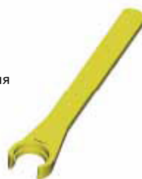
E - Zeta накладной зажимной ключ