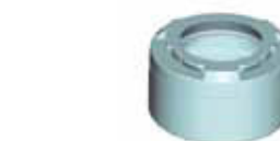
Стандартная зажимная гайка ERM - Zeta