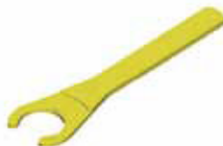
ESP - Zeta накладной зажимной ключ