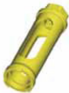
EC - Zeta удлинитель