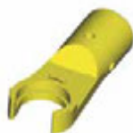
ET - Zeta адаптер-переходник для динамометрического ключа