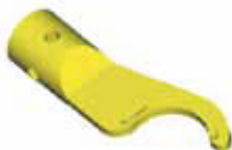
ETET - Zeta адаптер-переходник для динамометрического ключа