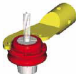
ERST - Zeta адаптер-переходник ERST - Zeta зажимная гайка